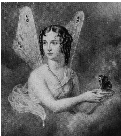
Lucile Grahn dansede til førsteopførelsen af Sylfiden i 1836. Maleri af Lucile Grahn i rollen som Sylfiden. Af Edvard Lehmann. Teatermuseet.